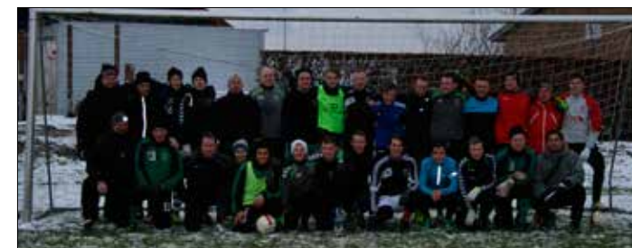
25 mand til første træning