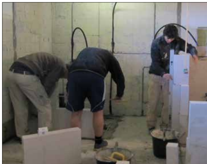
Renovering af omklædningsrummene

Sidste skud på stammen af nye idrætsgrene i Lemming IF er Mountainbike (se artikel andet sted i bladet). Det er dejligt, at der er folk, der byder sig til, for at få sat gang i nye tiltag i idrætsforeningen.