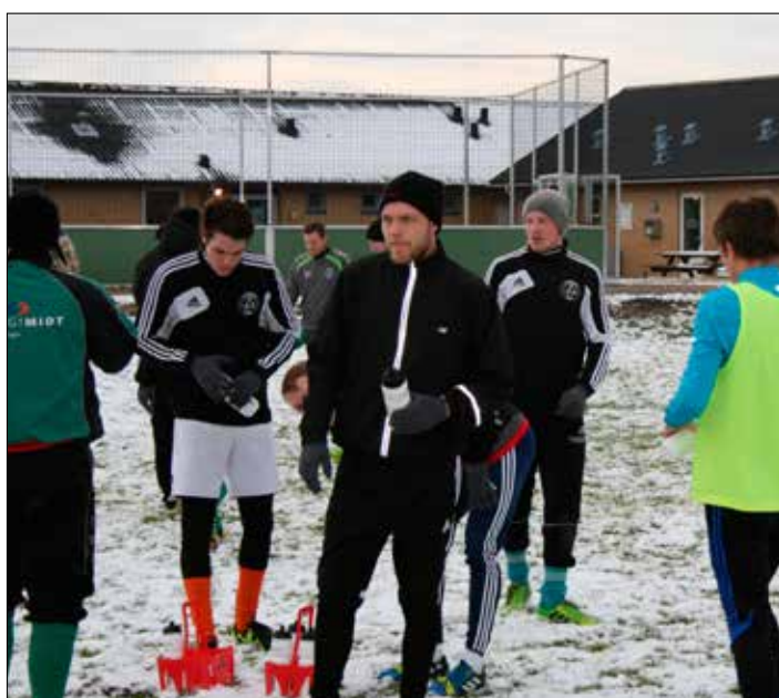
Fodboldsæsonen er skudt igang!