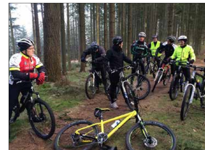
Mountainbikerne i skoven

Mountainbike: Lørdage kl. 10.00 fra parkeringspladsen ved Vestre Søbad. Alt efter hvem der møder op deles i mindre grupper, så niveau, dagsform og forventninger til bakker og tempo passer nogenlunde sammen. Du skal forvente sved på panden og være indstillet på at trampe med alt hvad du har. Find os også på facebook: 'MTB - "kom nu af sted", Lemming IF'. Er du begynder på mtb, så kom til introen 12. april. Herefter vil vi tilrettelægge begyndetræning for nye medlemmer.