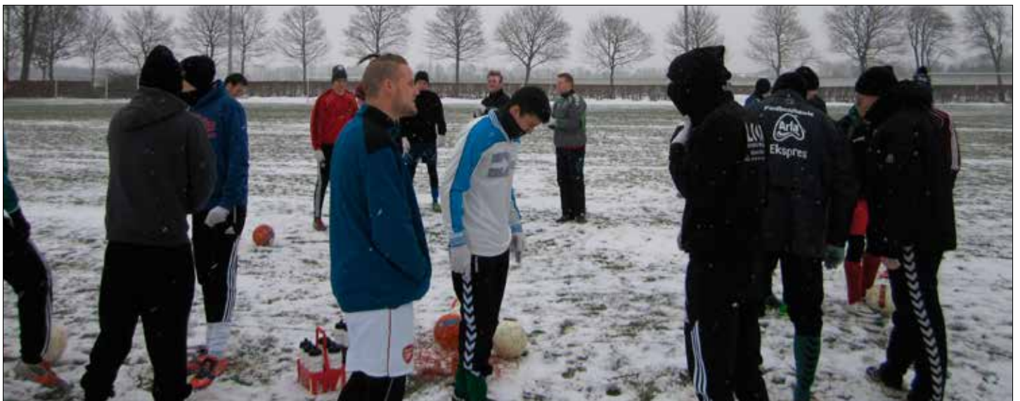
Fodbold opstart i sne og frost ...