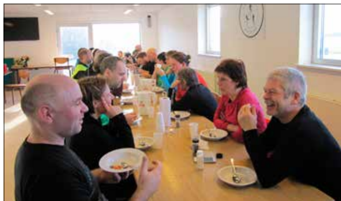
Det varmer godt med suppe efter løbeturen, og så er der luft til hyggesnak.

Vi er begyndt nogen gange at mødes andre steder for at løbe. Det er trods alt meget de samme ruter, man kommer til at løbe på, når man altid starter ud fra klubhuset. I efteråret kørte vi til Almindsø og løb på nogle dejlige ruter i skovene deromkring. Sidst i januar mødtes vi en søndag ved Tromlehuset på Holmmøllevej for at løbe en tur ind igennem skoven. Det tager lidt længere tid, når vi skal køre andre steder hen, men det giver også nogle gode oplevelser og nogle spændende løbeture.