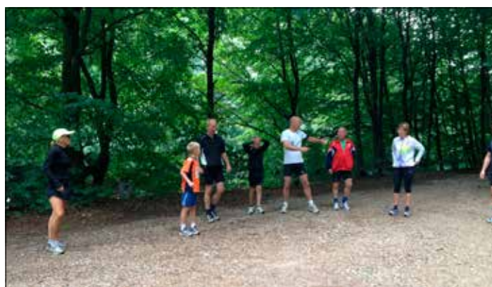
På en af vores løb-ude-løb tog vi til Almindsø og løb i de smukke skove deromkring.

Søndag d. 6. april er der opstart af nye løbehold. Denne dag har du muligheden som ny løber, for at komme godt fra start. Vi snakker lidt om, hvad der skal til for at blive en løber, og du får udleveret et løbeprogram, der kan følge dig i mål. Derefter løber vi første punkt på programmet og slutter af med spørgsmål og evaluering.