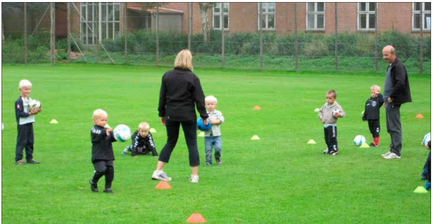
Fodbold for de mindste